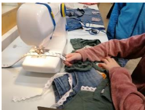
Redesign lager nye klær av gamle ting

I løpet av året tilbyr vi ulike temakurs, som hver tar et dypdykk inn i en ferdighet eller et kunnskapsområde. Vi har kurs som Snekkerkurs, Forskerspirene, Kodekurs på iPad/PC, sjakk-kurs, dans, sang og musikk, svømming, turn og mye annet spennende! Disse er alle knyttet til skolens læreplaner. Hvert kurs introduseres for elevene i forkant, og eleven melder seg selv på under AKS-måltidet uken før kursstart.