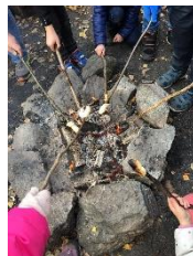
Friluftsliv lærer å tenne bål, spikke og utforsker naturen i nærområdet