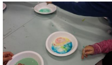
Forskerspirene eksperimenterer med farger, lager slim og gegasåpebobler, og eksperimenterer med vann og is