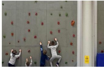
Klatring i gymsal