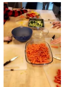
Stjernekokker lager mye god mat!